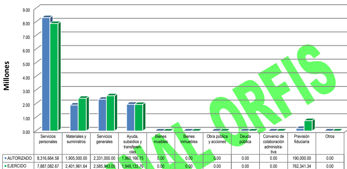
GRÁFICA 2 EGRESOS